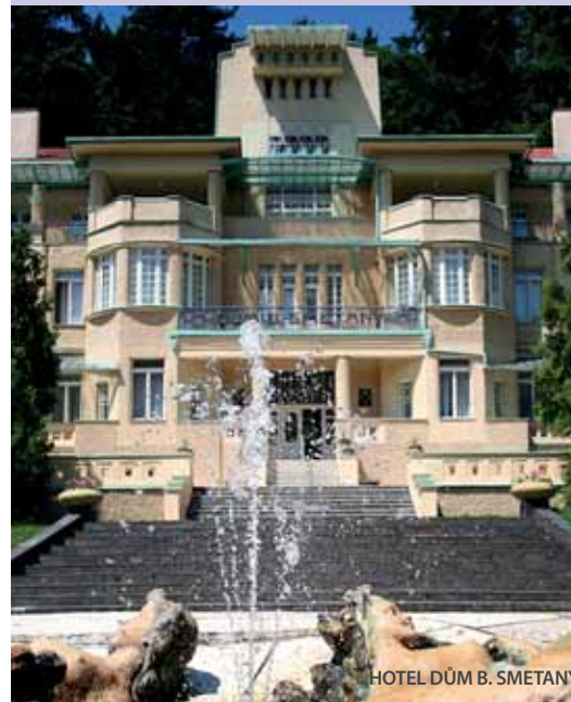
HOTEL DŮM B. SMETANY