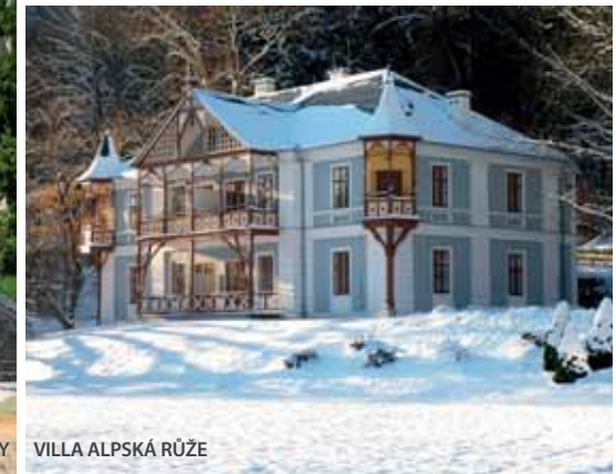
VILLA ALPSKÁ RŮŽE